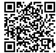
Código QR da linha direta de Ética

Todos temos a obrigação de denunciar conduta antiética ou ilegal ou se houver motivos razoáveis para acreditar que ocorreu uma violação deste Código. Nossa disposição em Buscar ajuda e descrever a situação pontualmente, de forma precisa e confiável, é de máxima importância. A Thomson Reuters valoriza a comunicação aberta.