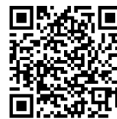
QR-код горячей линии по вопросам этики

Мы призываем вас задавать вопросы и обращаться за помощью , если у вас возникают какие-либо опасения. Сообщайте о них, даже если вы не уверены в том, что возникла какая-то проблема. Сообщить об опасениях можно своему руководителю, в отдел кадров, отдел главного юриста, отдел нормативно-правового